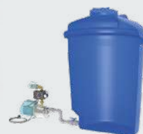
Montage hors de la citerne