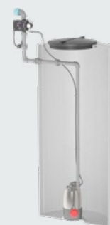
Montage dans la citerne