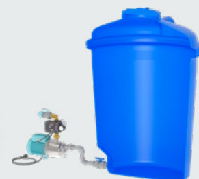
Montage hors de la citerne