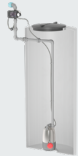
Montage dans la citerne