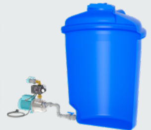
Montage hors de la citerne