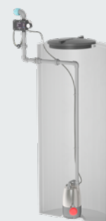
Montage dans la citerne