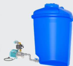
Montage hors de la citerne