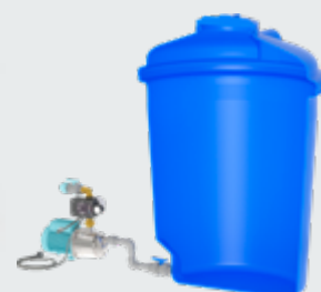
Montage hors de la citerne