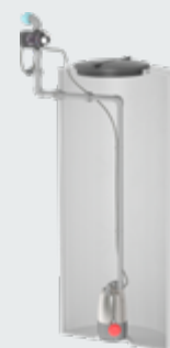
Montage dans la citerne