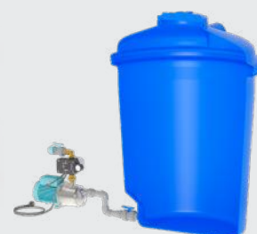
Montage dans la citerne