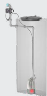
Montage dans la citerne